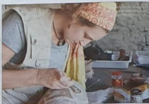
Restaurando una pieza cerámica