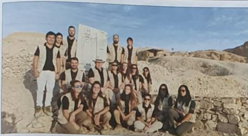
Equipo que trabaja en la excavación del vizir Amen-Hotep Hoy

carilla y con el gel hidroalcohólico en la mochila. A la hora de trabajar, no nos afecó mucho, ya que los mismos que trabajábamos convivíamos juntos, así que éramos como una burbuja. Los egipcios llevaban el tema del covid-19 más relajado, decían que era un "virus europeo" y que a ellos no les afectaba, pero nosotros veníamos muy concienciados de España.