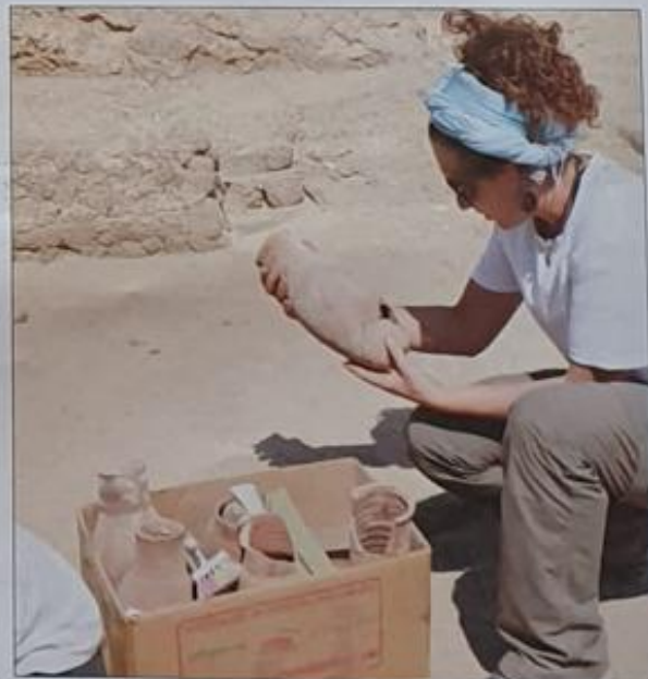
Observando una de las piezas aparecidas en la tumba de Amen-Hotep III

Para viajar tuve que hacerme una PCR 48 horas antes del vuelo y una vez en Luxor, lo mismo que aquí. Siempre salíamos a la calle con mas-